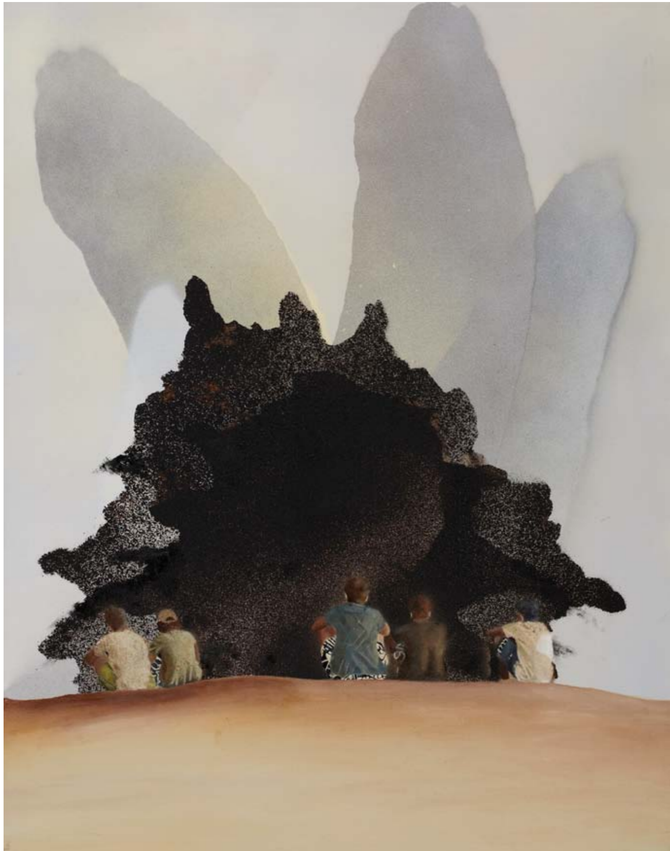
2011, ספריי ושמן על בד, 80/60 ס"מ 2011, Spray & oil on canvas, 80/60 cm