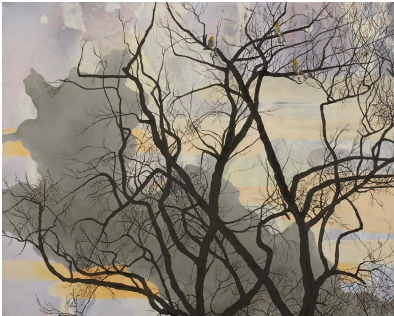
2011, ספריי ושמן על בד, 61/77 ס"מ 2011, Spray & oil on canvas, 61/77 cm