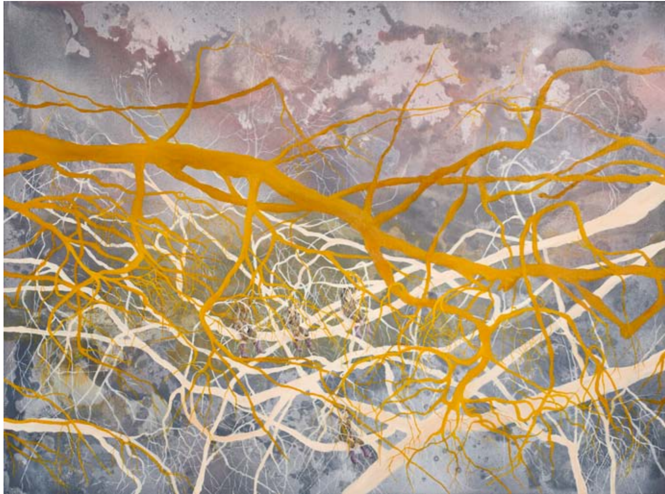
2010, ספריי ושמן על בד, 60/80 ס"מ 2010, Spray & oil on canvas, 60/80 cm