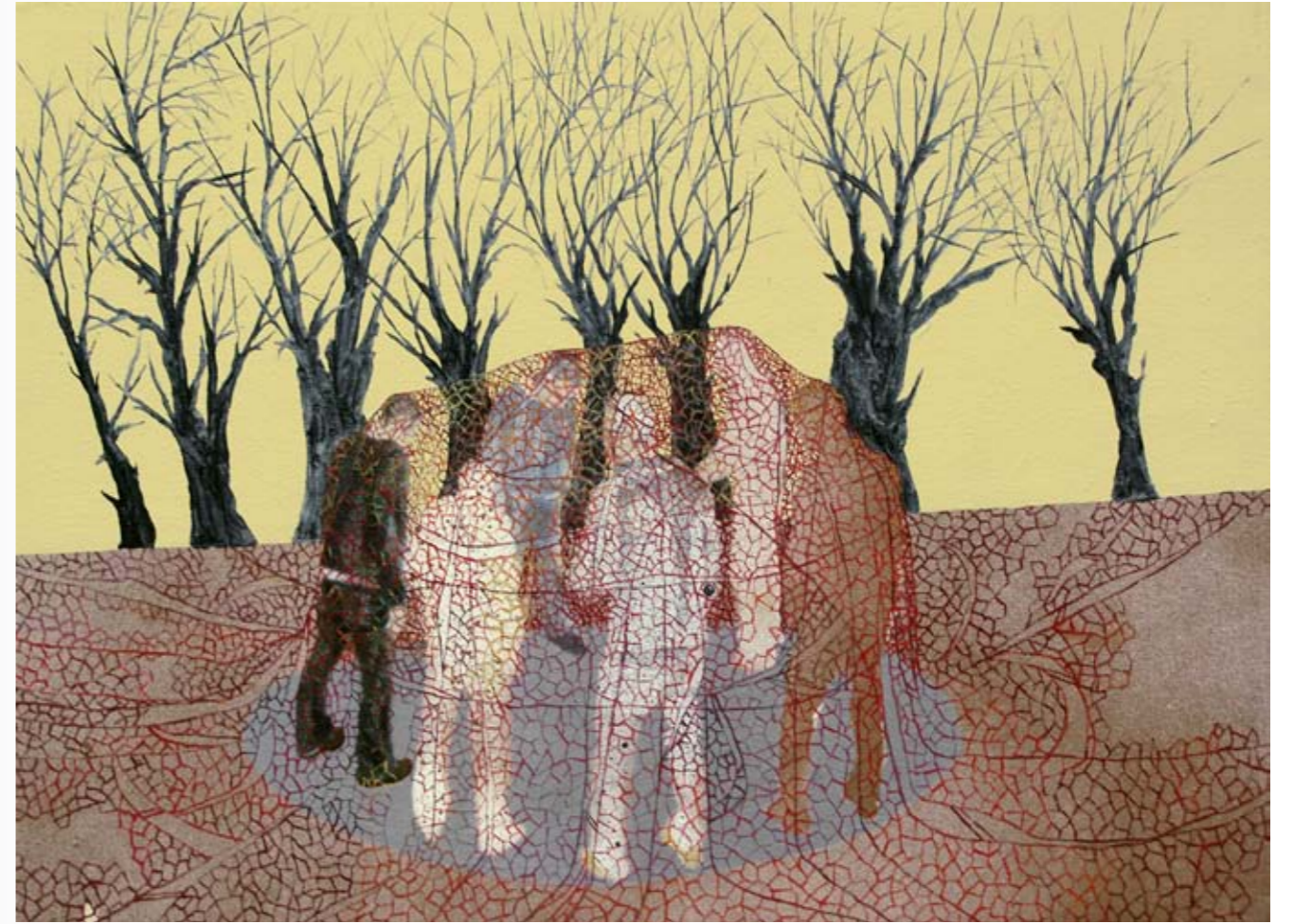
2010, ספריי ושמן על בד, 30/40 ס"מ 2010, Spray & oil on canvas, 30/40 cm