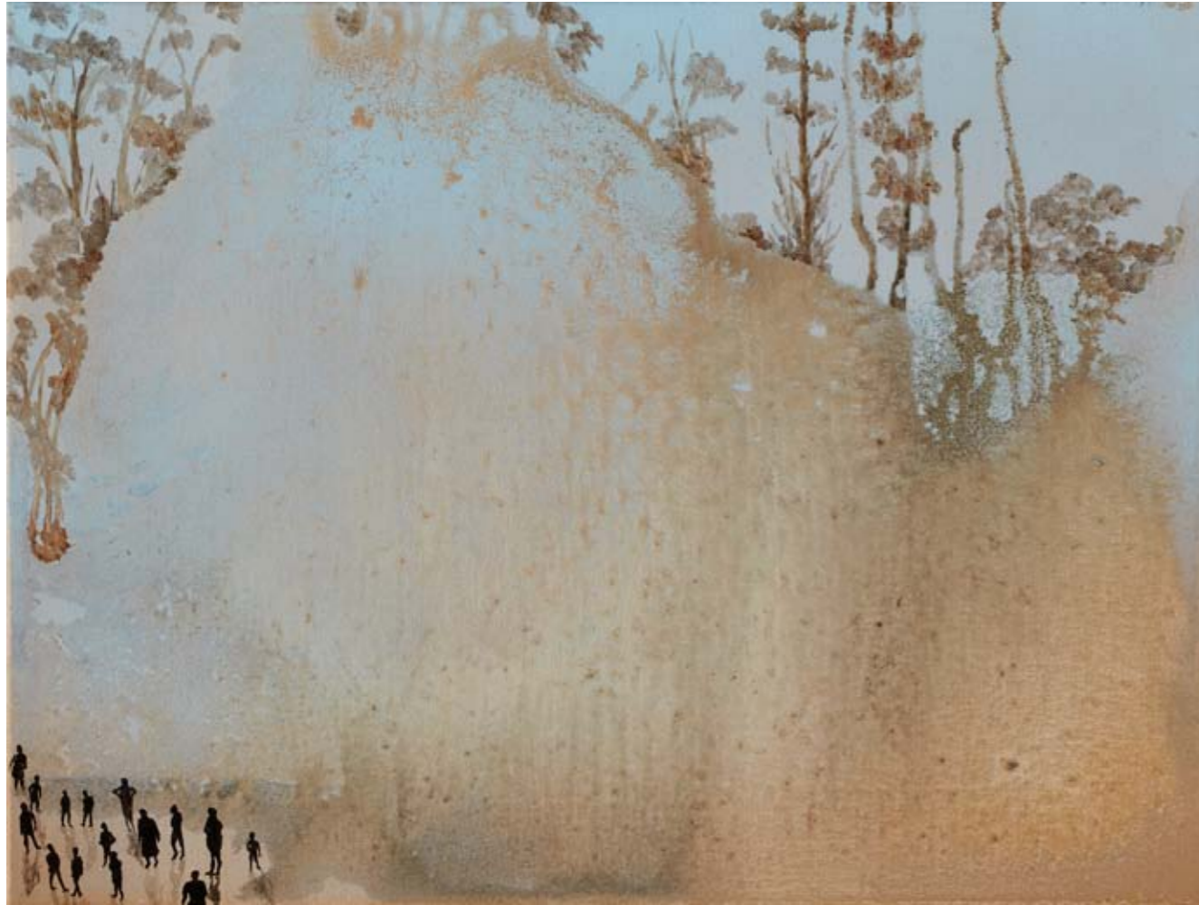
2011, ספריי ושמן על בד, 30/40 ס"מ 2011, Spray & oil on canvas, 30/40 cm