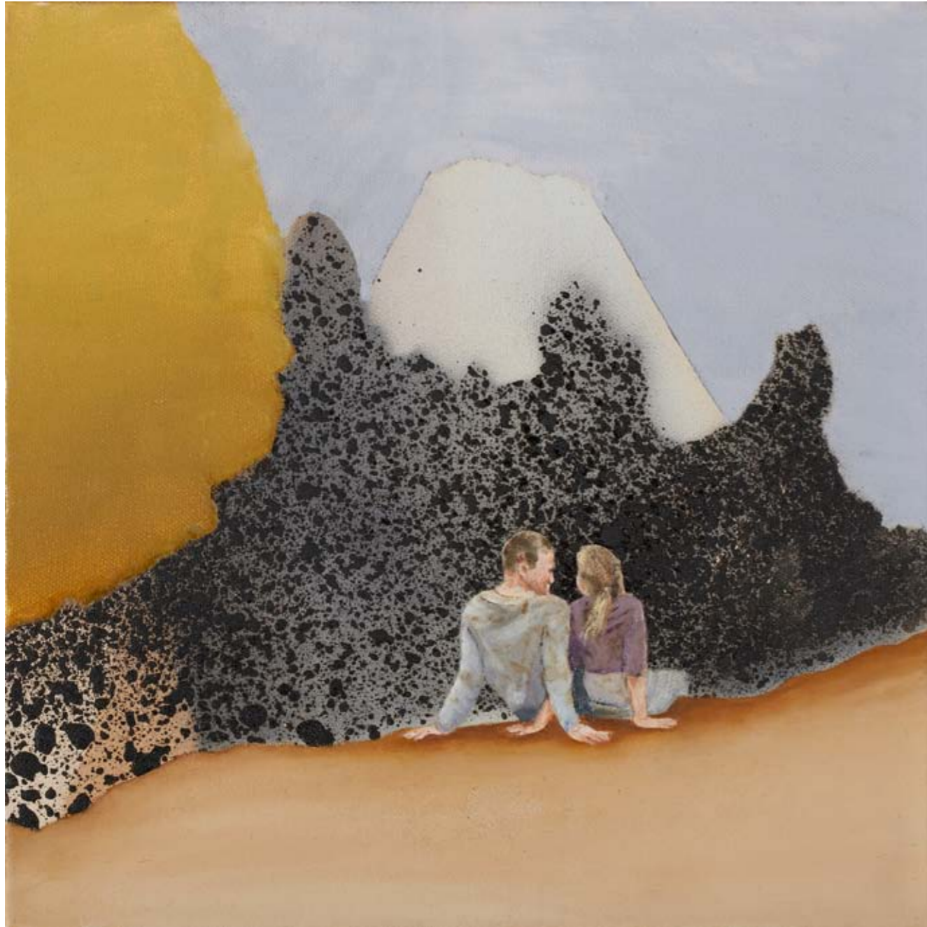
2011, ספריי ושמן על בד, 30/30 ס"מ 2011, Spray & oil on canvas, 30/30 cm