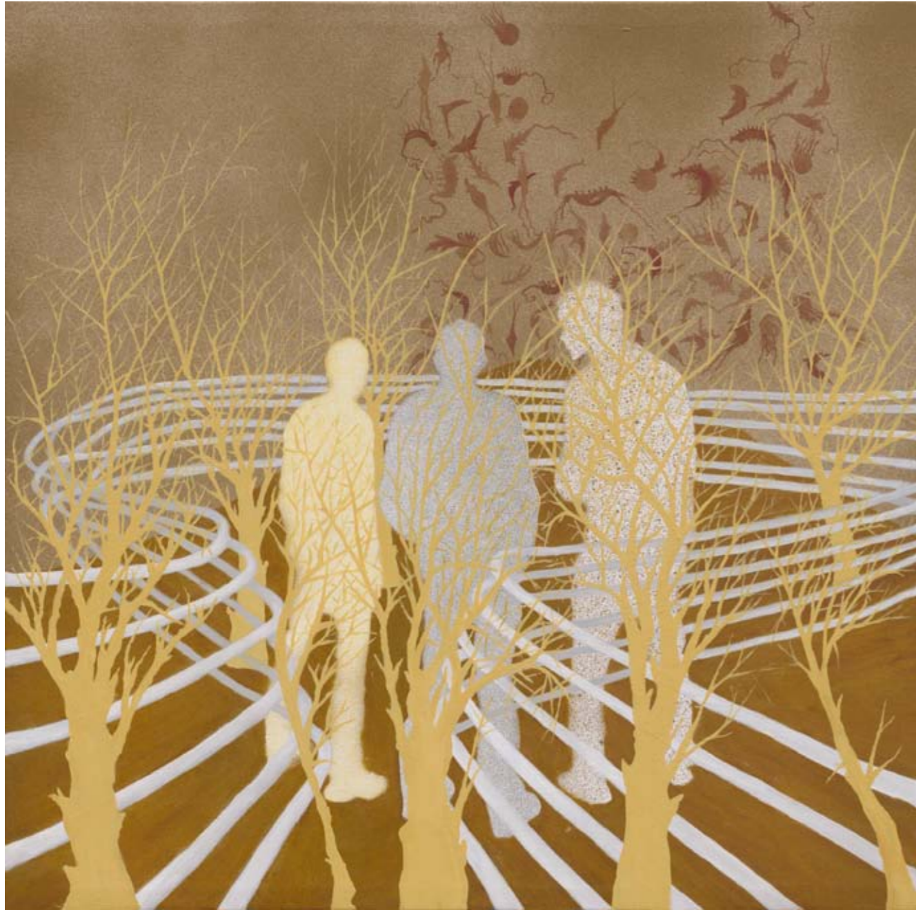
2010, ספריי ושמן על בד, 44/44 ס"מ 2010, Spray & oil on canvas, 44/44 cm