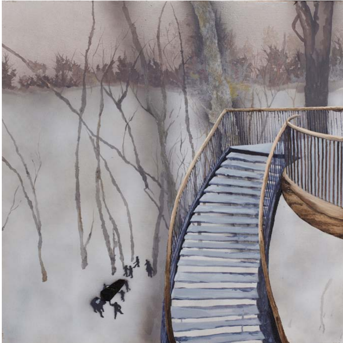
2011, ספריי ושמן על בד, 76/76 ס"מ 2011, Spray & oil on canvas, 76/76 cm