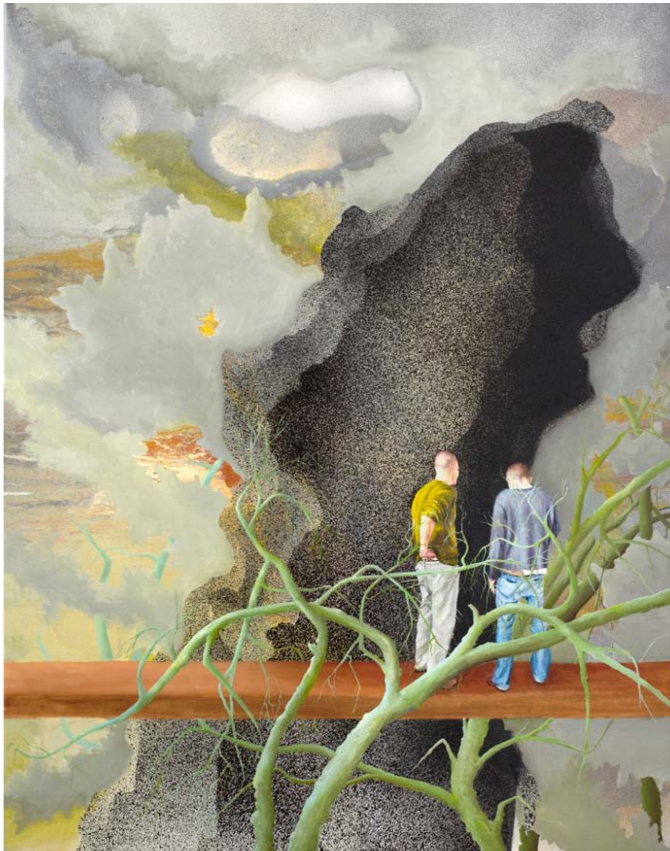
2011, ספריי ושמן על בד, 90/70 ס"מ 2011, Spray & oil on canvas, 90/70 cm