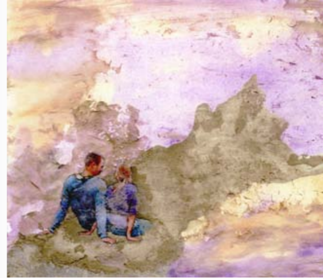
מתווה, 2011, ספריי ושמן על בד, 21.5/25 ס"מ Sketch, 2011, spray & oil on canvas, 21.5/25 cm