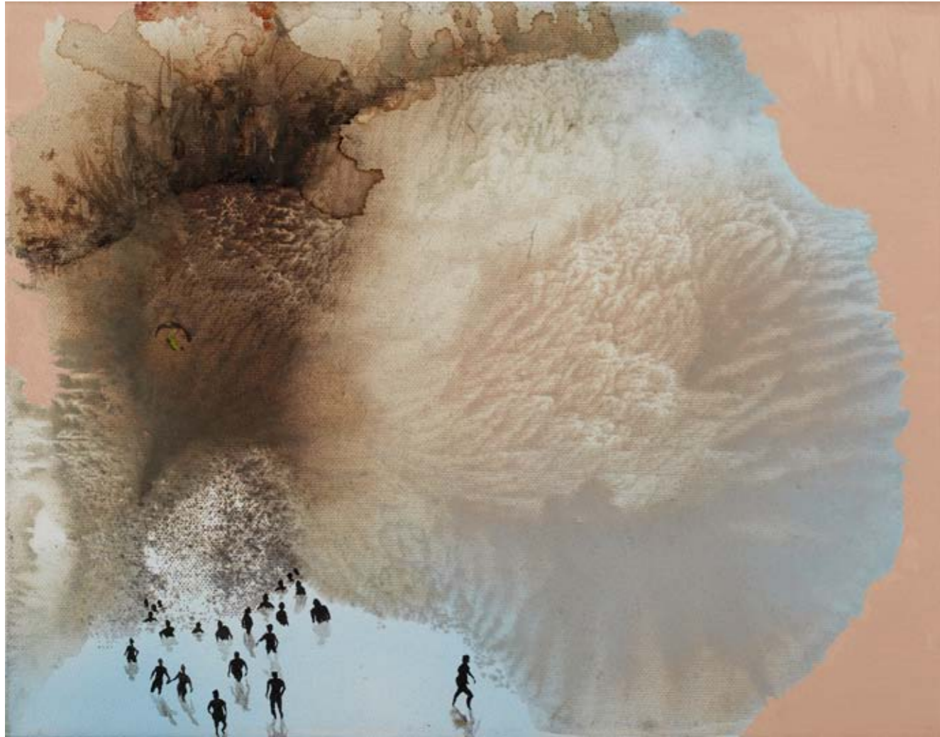
2011, ספריי ושמן על בד, 27/35 ס"מ 2011, Spray & oil on canvas, 27/35 cm