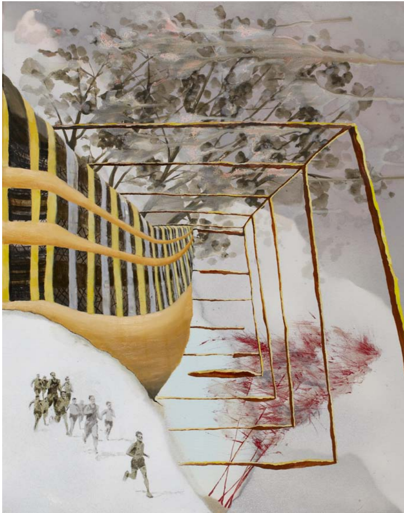
2011, ספריי ושמן על בד, 76/61 ס"מ 2011, Spray & oil on canvas, 76/61 cm