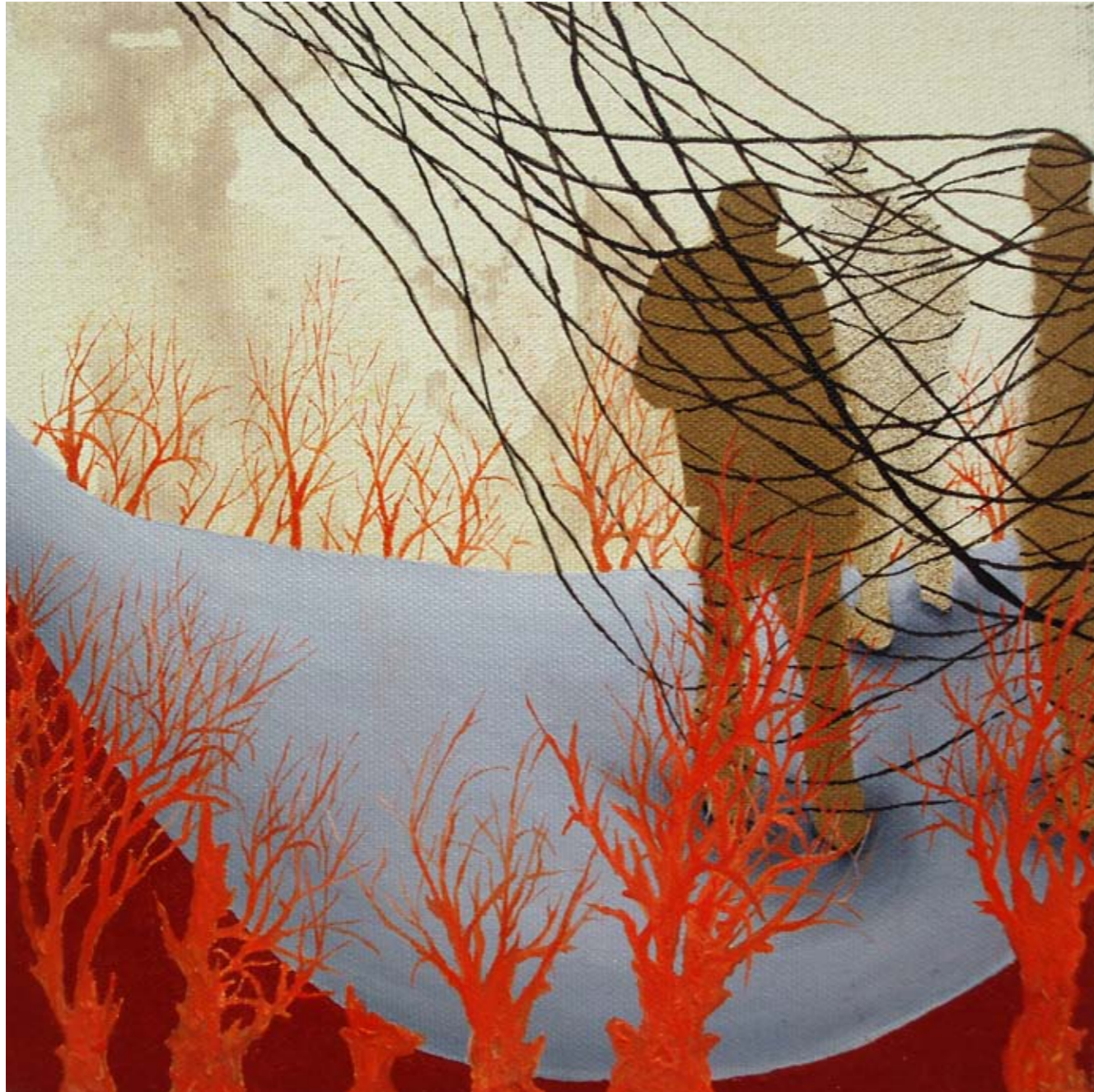
2010, אקריליק ושמן על בד, 20/20 ס"מ 2010, Acrylic & oil on canvas, 20/20 cm