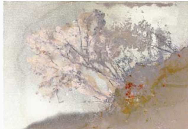
מתווה, 2011, ספריי ושמן על בד, 16.5/24.5 ס"מ Sketch, 2011, spray & oil on canvas, 16.5/24.5 cm