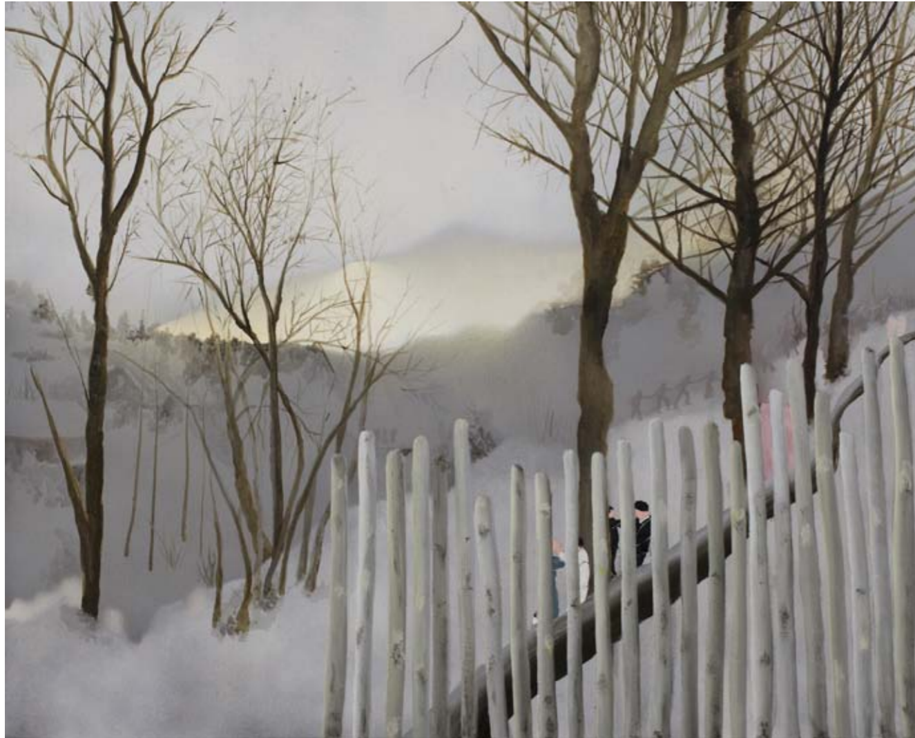
2011, ספריי ושמן על בד, 61/76 ס"מ 2011, Spray & oil on canvas, 61/76 cm