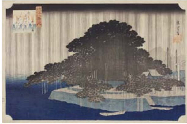
אנדו הירושיגה, גשם לילה בקאראסאקי, מתוך "שמונה מראות אומי", בערך 1834, הדפס עץ צבעוני, 25.6/38.7 ס"מ