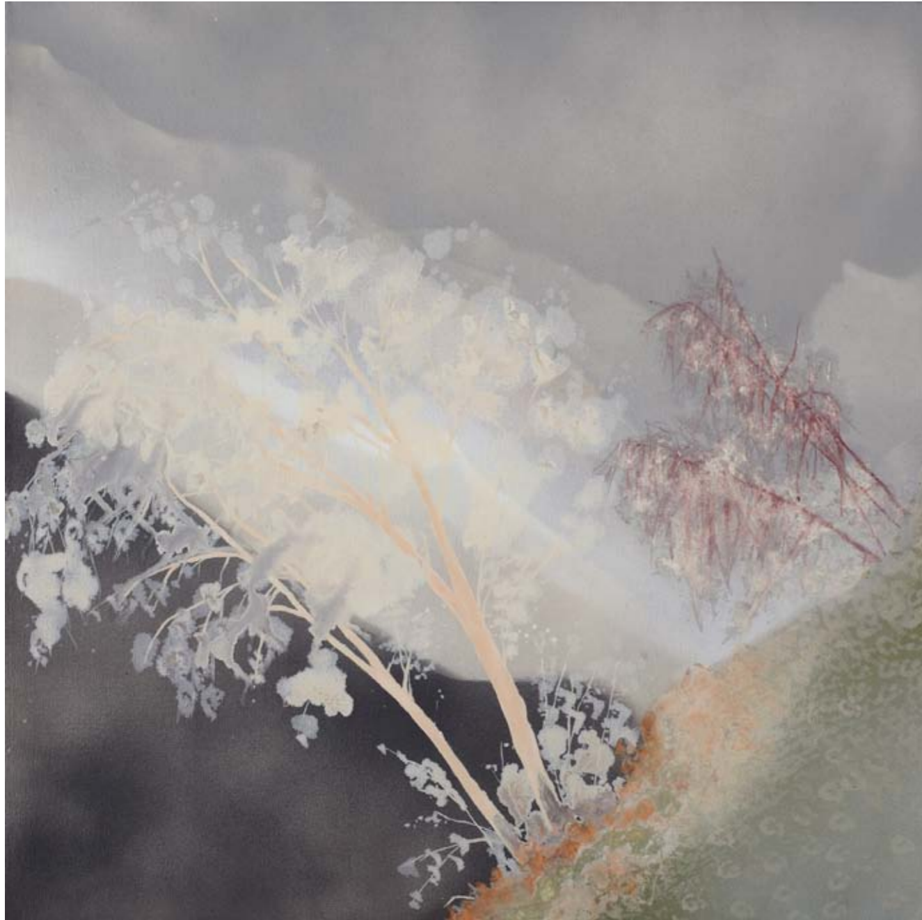
2011, ספריי ושמן על בד, 61/61 ס"מ 2011, Spray & oil on canvas, 61/61 cm