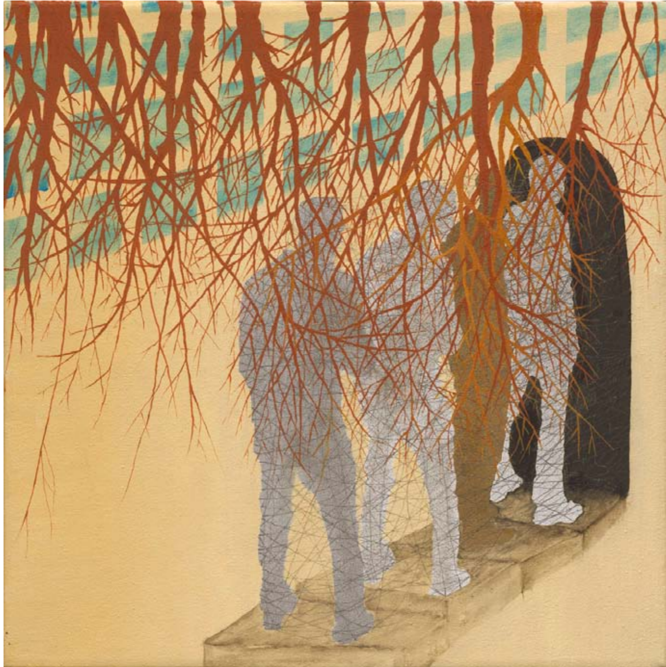
2010, ספריי ושמן על בד, 40/40 ס"מ 2010, Spray & oil on canvas, 40/40 cm