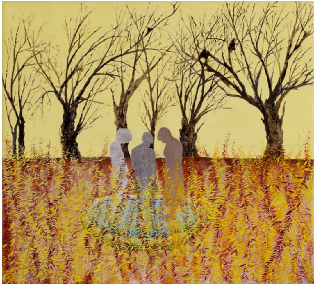
2010, ספריי ושמן על בד, 27/30 ס"מ 2010, Spray & oil on canvas, 27/30 cm