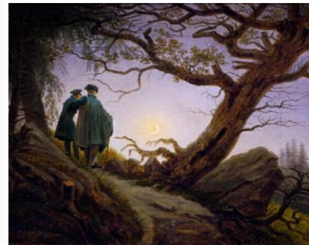
קספר דויד פרידריך, שני אנשים מתבוננים בירח, 1830-1825, שמן על בד, 34.9/43.8 ס"מ, אוסף מוזיאון מטרופוליטן לאמנות, ניו יורק

Caspar David Friedrich, Two Men Contemplating the Moon , 1825-1830, oil on canvas, 34.9/43.8 cm, The Metropolitan museum of art collection, New York